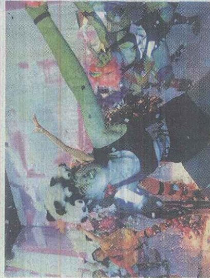
"נערות מופרעות מצילות את העולם"