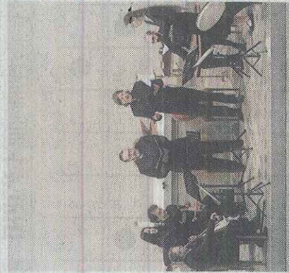
אנסמבל סרנוד מטורקיה